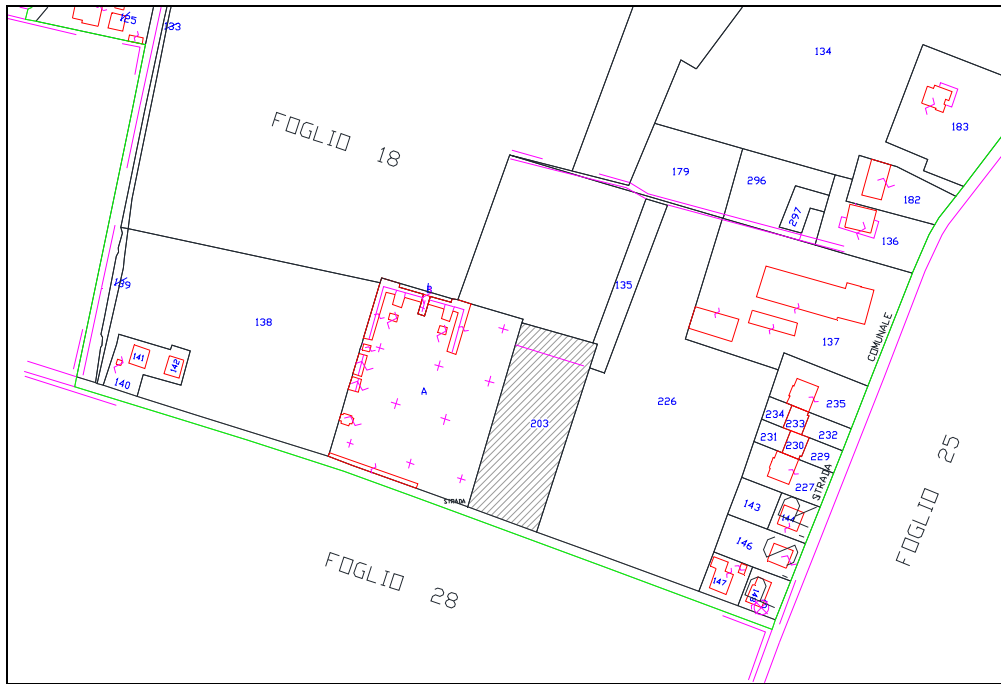
Estratto catastale, Foglio 18, Particella 203