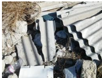
I rottami abbandonati di coperture in cemento-amianto

Seguendo in modo rigoroso l'apposita procedura messa a punto grazie alla collaborazione fra Provincia di Modena, ARPA, AUSL ed Enti Gestori del Servizio Rifiuti, i privati cittadini possono effettuare in modo autonomo la rimozione di modeste quantità di manufatti contenenti amianto in matrice compatta e conferirli gratuitamente al servizio pubblico. La procedura è disponibile sul sito: http://www.ausl.mo.it/dsp/flex/cm/pages/ServeBLOB.php/L/IT/IDPagina/1882